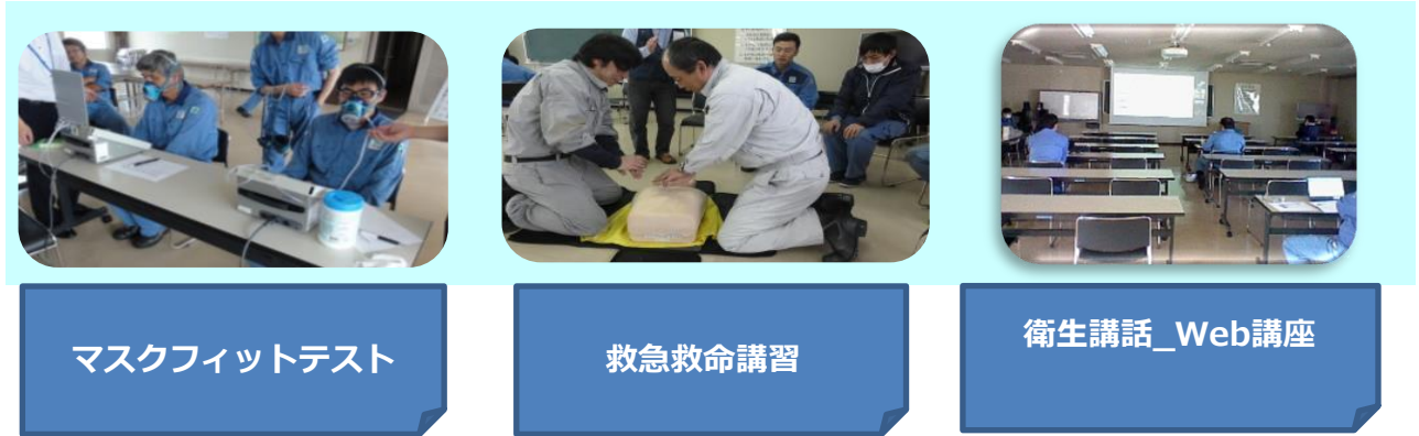
マスクフィットテスト